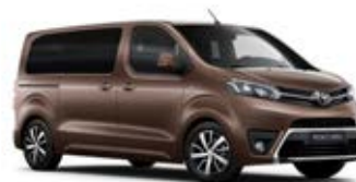
KCM Hnědá – dubová* metalický lak 15 000 Kč