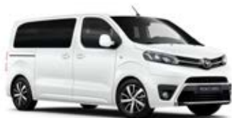
EWP Bílá – arktická standardní lak bez příplatku