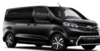
KTV Černá – Sicílie metalický lak 15 000 Kč