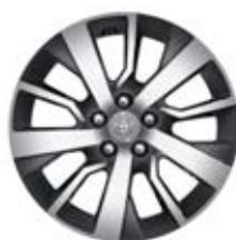
17" Kola z lehkých slitin Pro výbavu VIP, volitelná výbava pro verze Shuttle a Family