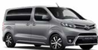
KCA Stříbrná – atomická metalický lak 15 000 Kč