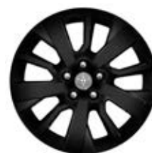
17" Kola z lehkých slitin Pro výbavu Selection