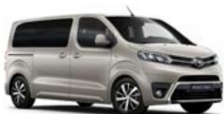
NEU Běžová – sametová* metalický lak 15 000 Kč