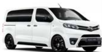
EWP Bílá – arktická Vyobrazený model je dostupný pouze pro verzi Selection standardní lak bez příplatku