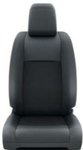
Čalounění sedadel tmavě šedé – textilie Pro výbavu Kombi a Shuttle