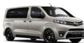
NEU Běžová – sametová Vyobrazený model je dostupný pouze pro verzi Selection metalický lak 15 000 Kč

* Barva je dostupná jen pro výbavové stupně Shuttle, Family a VIP