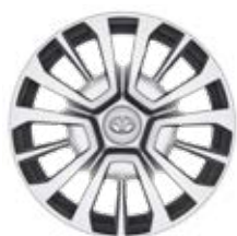
16"/17" Ocelové disky kol Pro výbavu Shuttle (16") a Family (17")