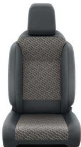
Čalounění sedadel Toyota v kombinaci černé a hnědé barvy – textilie Pro výbavu Family