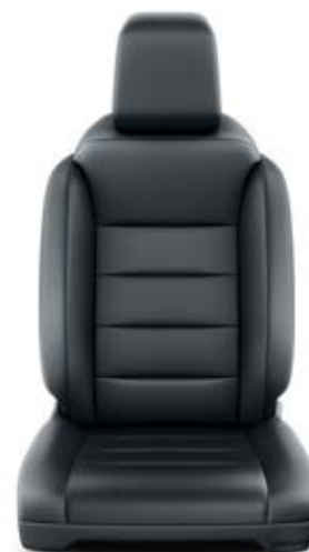
Čalounění sedadel černé kožené Pro výbavu VIP a Selection, paket Executive