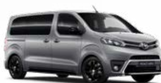
KCA Stříbrná – atomická Vyobrazený model je dostupný pouze pro verzi Selection metalický lak 15 000 Kč