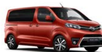
KHK Červená – turmalínová* metalický lak 15 000 Kč