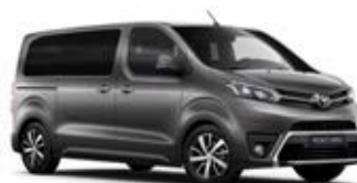
EVL Šedá – tmavá metalický lak 15 000 Kč