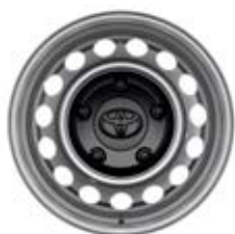
16" Ocelové disky kol se středovými kryty Pro výbavu Kombi